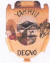
TABLA DE APLICABILIDAD DE LAS OBLIGACIONES DE TRANSPARENCIA Y ACCESO A LA INFORMACION PÚBLICA (LTGAIP)